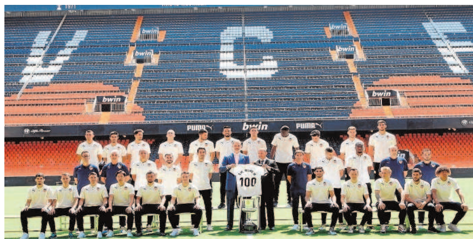
El Rey, junto a los integrantes del Valencia Club de Fútbol

Los ocho años de Visiedo al frente de la Universidad CEU Cardenal Herrera se han caracterizado, entre otras cosas, por un importante crecimiento de estudiantes, una decidida apuesta por la internacionalización –el 30 por ciento del alumna-